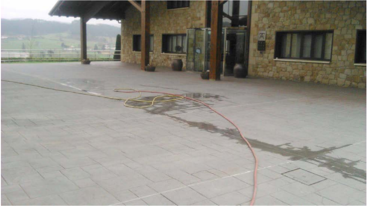
Figure 2 AVANT