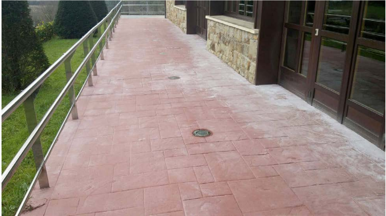
Figure 4 AVANT