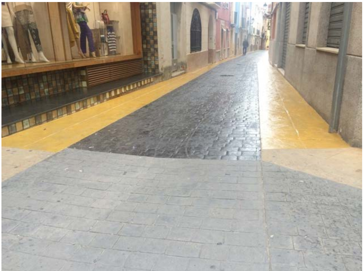
Figure 1AVANT & APRES

Produit élaboré pour la rénovation des sols bétons avec ou sans modification des coloris.