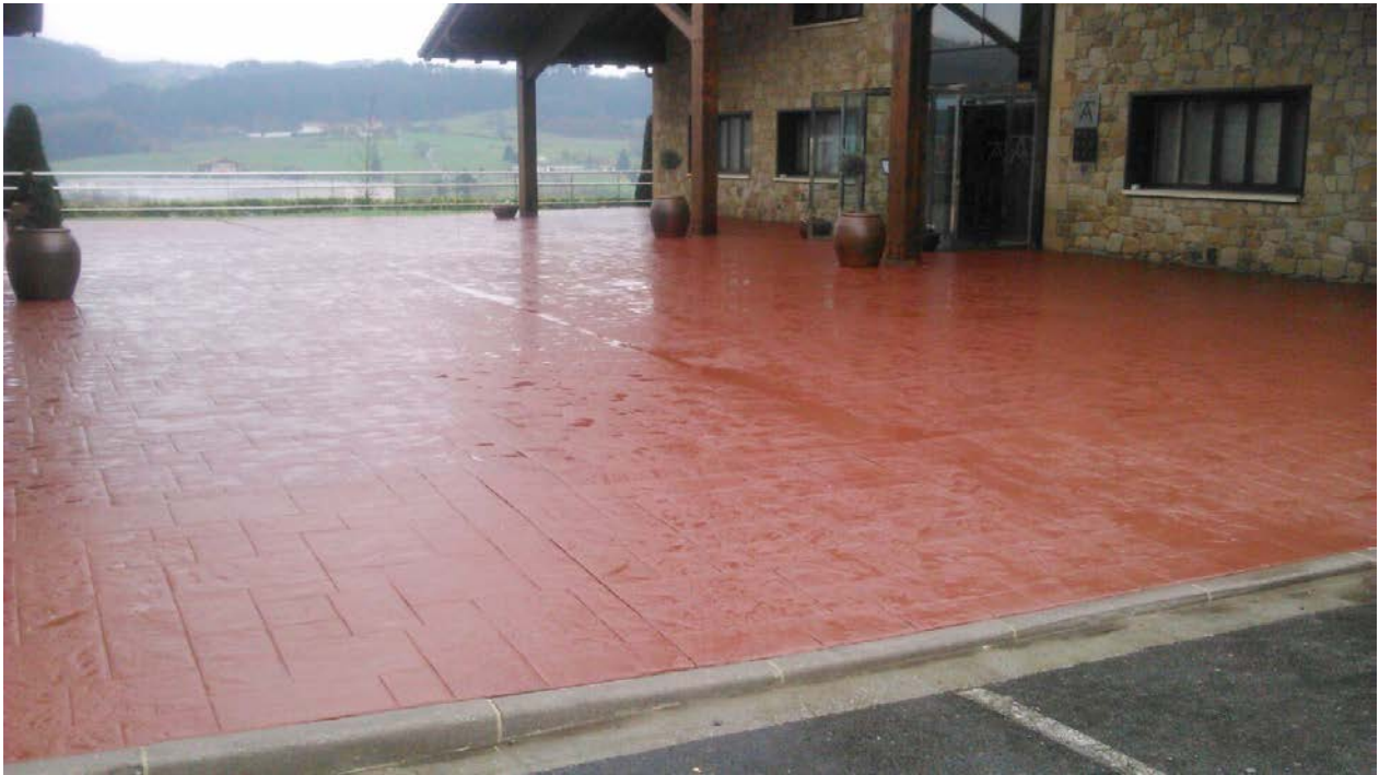
Figure 3 APRES